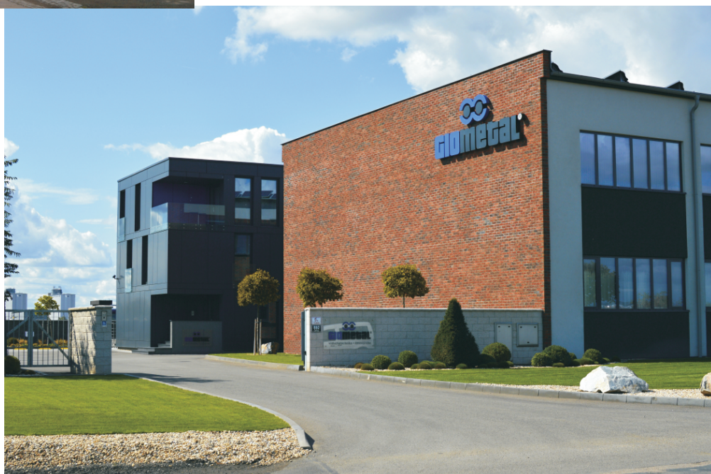
Areál firmy GIOMETAL po rekonstrukci