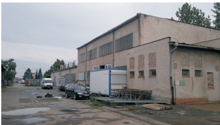
Areál firmy GIOMETAL před rekonstrukcí

„Začínal jsem se třemi lidmi a dnes mám pod sebou 25 zaměstnanců. Mám vedoucího výroby a ve výrobě 20 lidí. Mám vedoucího obchodu a 5 lidí v administrativě. A hlavně mám volnější ruce a čas vymýšlet, kam firmu posunout dál. Nechci tady dalších 30 let sedět, vše udržovat v současném stavu a chodu a jen čekat na důchod. Potřebuji mít před sebou nějakou vizi, cíl, ke kterému budu směřovat,“ popisuje současné rozpoložení Ing. Igor Pazdera.